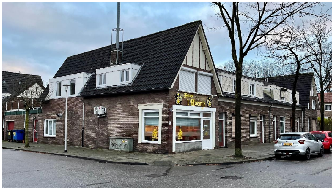
Tuindorp Slakhorst, Hoensbroek