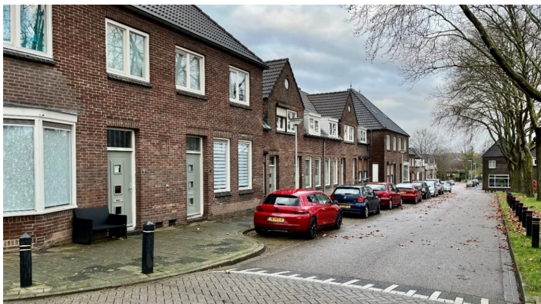
Hovenstructuur in tuindorp De Passart

In totaal bestaat de woningvoorraad in Heerlen-Noord voor iets meer dan de helft (53 procent) uit huurwoningen, waarvan 40 procent corporatiewoningen en 13 procent particuliere huurwoningen. Sommige buurten bestaan voor het overgrote deel uit corporatiebezit, terwijl een wijk als Vrieheide vrijwel uitsluitend particuliere woningen telt (zowel in bezit van eigenaar-bewoners als particuliere verhuurders). In Heerlen-Noord zijn verschillende woningcorporaties actief: Woonpunt heeft verreweg het meeste bezit, daarna Weller en Vincio Wonen en tenslotte Wonen Limburg. De gemiddelde WOZ-waarde ligt in Heerlen-Noord, met 135.000 euro, fors lager dan het landelijk gemiddelde van 290.000 euro. 6